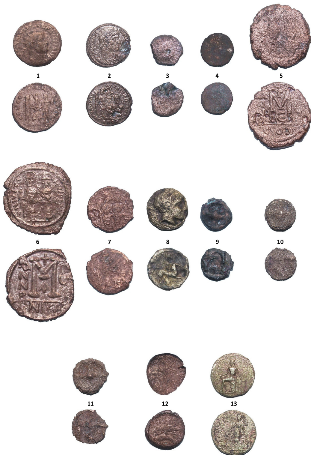
Fig. 2. Monede descoperite în cursul cercetărilor la Histria, Sectorul Acropolă Centru-Sud (2013–2014) / Coins found during the excavations at Histria, the Acropolis Centre-South Sector (2013–2014).