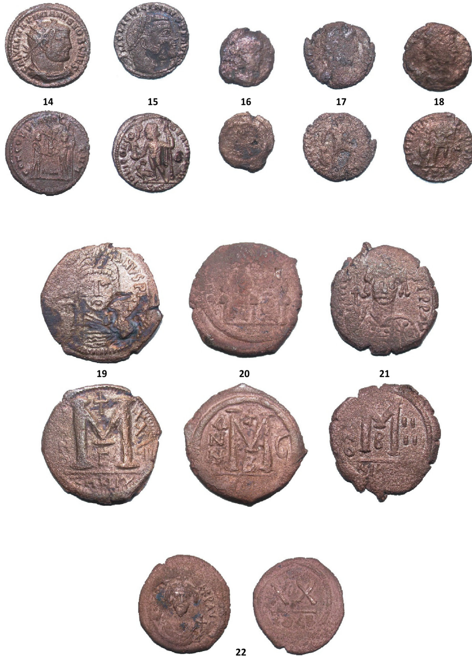
Fig. 3. Monede descoperite în cursul cercetărilor la Histria, Sectorul Acropolă Centru-Sud (2013–2014) / Coins found during the excavations at Histria, the Acropolis Centre-South Sector (2013–2014).